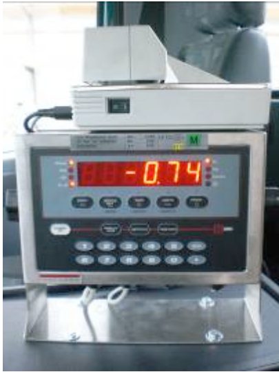
Weegsysteem met printer